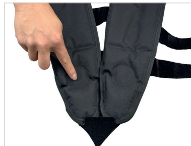
Modèle Enfant (S)

L'évidement au niveau des malléoles réduit le contact du froid sur celles-ci évitant ainsi d'engendrer des douleurs.