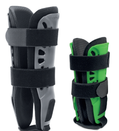
Modèle Adulte (M, L)