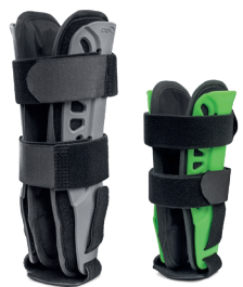
Modèle Adulte (M, L)