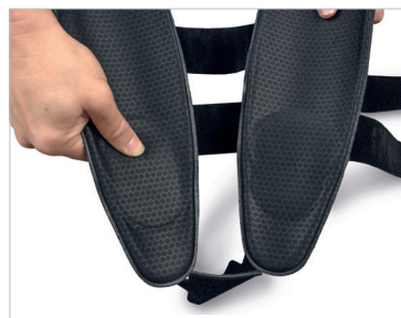
Modèle Enfant (S)

Les inserts en mousse à mémoire de forme aident à réduire la pression sur les malléoles.